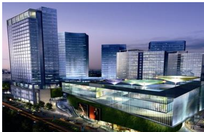
集团化公司：均适用