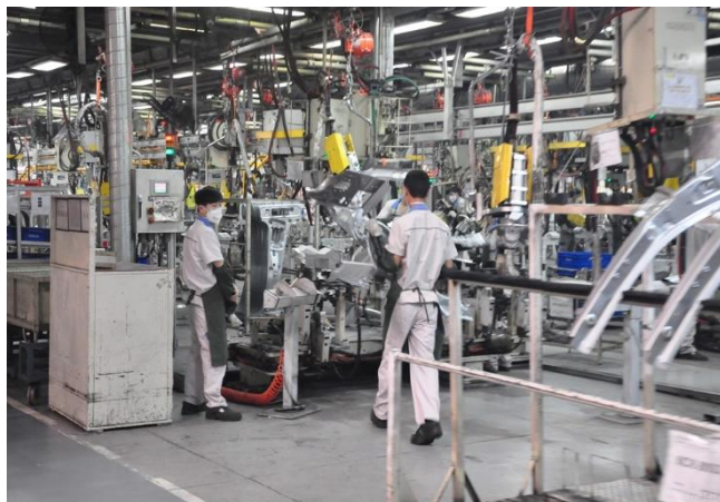
生产制造业：一维码资产盘点