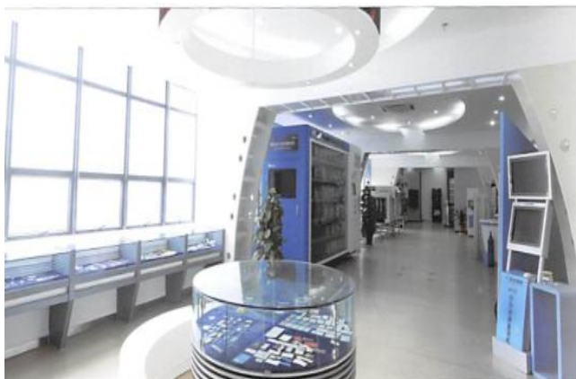
大型展厅：二维码资产管理