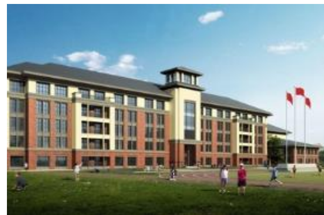
学校教育行业：BPO解决方案 (RFID标签) 盘点